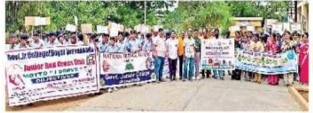
ఉరవకొండ: ప్రదర్శనగా వెళ్తున్న లయన్స్ క్లబ్, రిడ్స్ ప్రతినిధులు, విద్యార్థులు

రాయదుర్గం, కళ్యాణదుర్గం, ఉరవకొండ నియోజకవర్గాల్లో అంతర్జాతీయ ఎయిడ్స్ నియంత్రణ దినోత్సవాన్ని నిర్వహించారు. వివిధ ప్రభుత్వ, ప్రైవేటు పాఠశాలలు, కళాశాలలు, స్వచ్ఛంద సంస్థల ఆధ్వర్యంలో వీధుల గుండా ప్రదర్శనగా ర్యాలీ నిర్వహించారు. ఆయా పట్టణాలు, మండల కేంద్రాల్లో మానవహారంగా ఏర్పడి ప్రతిజ్ఞ చేశారు. ఎయిడ్స్ వ్యాధి పట్ల ప్రతిఙ్కరూ అప్రమత్తంగా ఉండాలని పలువురు వక్తలు సూచించారు. ప్రాణాంతక ఎయిడ్స్ మహమ్మారిని తరిమికొట్టి ఎయిడ్స్ రహిత సమాజం నిర్మాణం కోసం ప్రతి పౌరుడు కృషి చేయాలని పిలుపునిచ్చారు. ఎయిడ్స్ బాధితులు జాగ్రత్తలు