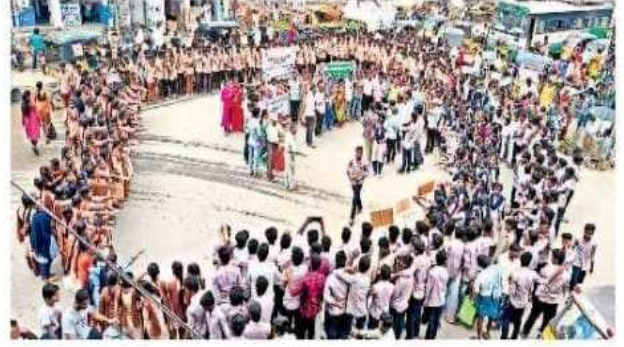
కళ్యాణదుర్గం గ్రామీణం: టీకూడలిలో మానవహారంగా ఏర్పడిన రిడ్స్, వైద్య సిబ్బంది, విద్యార్థులు