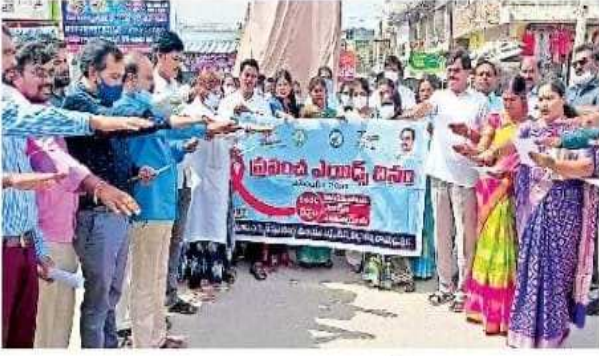
రాయదుర్గం పట్టణం: కేటీఎస్ ప్రభుత్వ డిగ్రీ కళాశాల విద్యార్థుల ప్రతిజ్ఞ