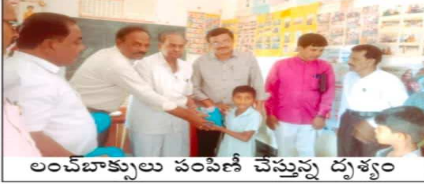
లంచ్ బాక్సులు పంపిణీ చేస్తున్న దృశ్యం

కళ్యాణదుర్గం టౌన్, డిసెంబర్ 18 ప్రభాతవార్త